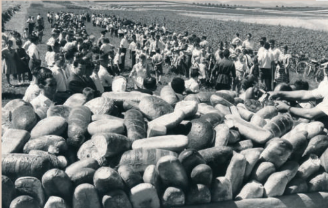
Brotweihe in Herxheim