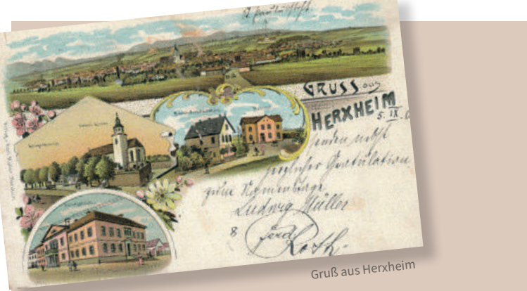
Grufs aus Herxheim