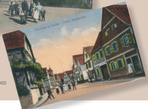
Obere Hauptstraße 1900